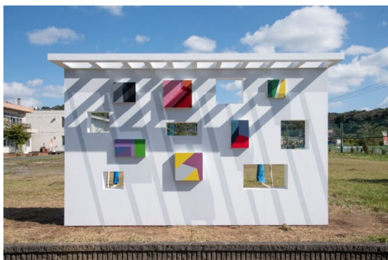
原田郁 《WHITE WALL》