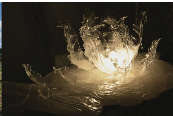
山田泉美 《PPlants garden》

【会期】2026(令和 8)年 3 月 20 日(金祝)、21 日(土)、22 日(日)、28 日(土)、29 日(日)